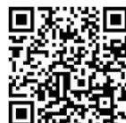
Stormarn smart entdecken